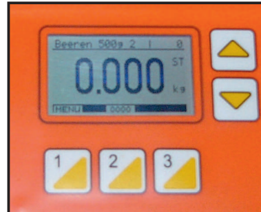
Control and display unit

Besides a single-use solution, TW 200 scales can be used in a combined system with up to three separate weighing lines and up to 31 scales per line.