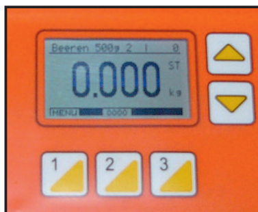
Kontroll- und Anzeige-Einheit

Alternativ oder zusätzlich zur numerischen Ergebnis-Anzeige kann eine farblich aufgeteilte Balkenanzeige montiert werden.