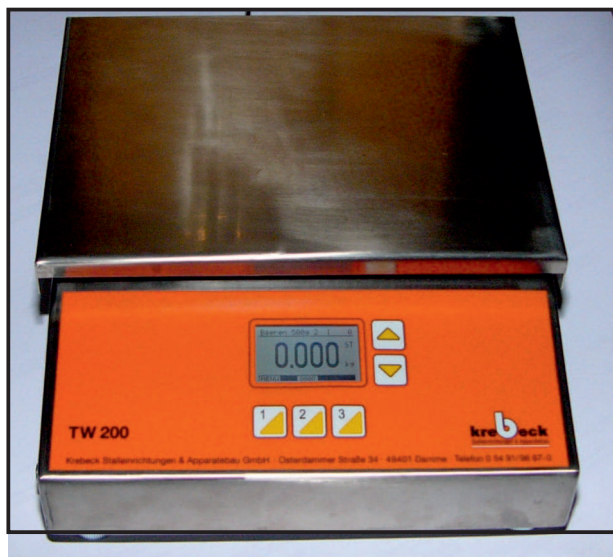
Tischwaage TW 200