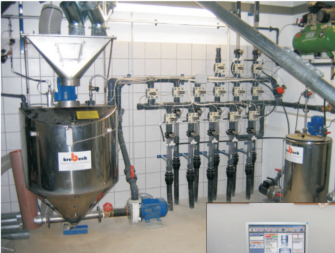
Futterzentrale mit Stegleitungen und Medikamenteneinspeisung